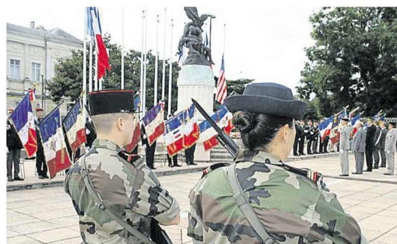
Angers, place Leclerc, hier matin. Les autorités civiles et militaires ont salué la mémoire des libérateurs de la ville.

La date du 10 août 1944 correspond à l'entrée à Angers des 10 e et 11 e régiments d'infanterie de la troisième armée de Patton. Dans la ville, la Voie de la Liberté emprunte l'avenue Patton, la rue Saint-Jacques, la place Monprofit, le boulevard Gaston-Dumesnil, le pont de la Basse-Chaine,